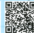
List of Funded Projects